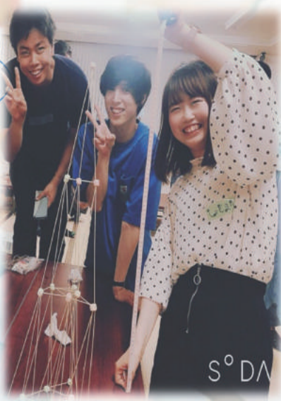
↑実際にやってみた写真 記録 42cm!!

このゲームは、 チームビルディング効果 が得られると いうことと、 高速でPDCAを回す こと(Plan-Do-Check- Action)が期待できるので様々なチーム構築の場で使われて います！